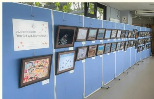
◀昨年度の野鳥観察館での展示の様子▶

※写真展②「藤前干潟写真展」への応募作品は、上記以外の場所で 展示を行うことがあります。