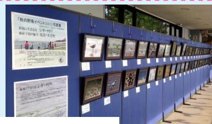
＜過去の写真展の様子＞