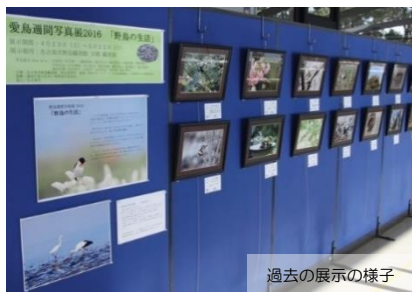
過去の展示の様子