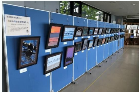
◀過年度の野鳥観察館での展示の様子▶

※写真展②「藤前干潟写真展」への応募作品は、上記以外の場所で 展示を行うことがあります。